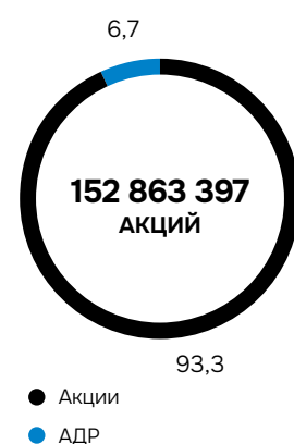
Распределение акций и АДР на конец 2023 года, %